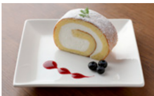
ロールケーキプレート

酸味のきいた紅玉りんごを使用し、りんご酒をしみ込ませた バウムクーヘンをパイ生地にとじこめました