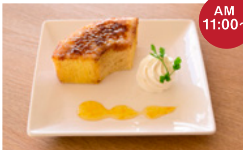
焦がしバウムプレート