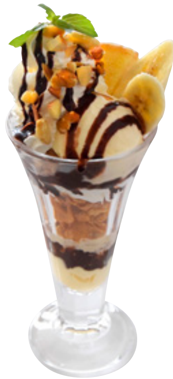
チョコバナナパフェ ¥900(税込)