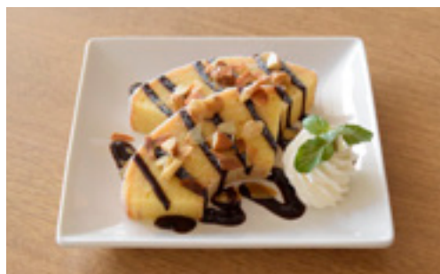
バウムクーヘンプレート(チョコナッツ)