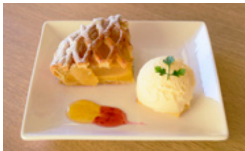
林檎パイプレート