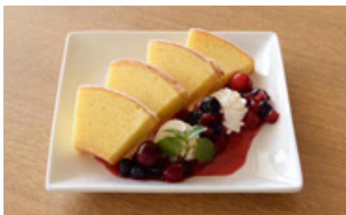
バウムクーヘンプレート(mixベリー)