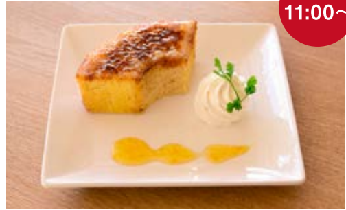
焦がしバウムプレート ¥700 香ばしくほろ苦いカラメルの風味が、 バウムクーヘンの味をいっそう引き立てます