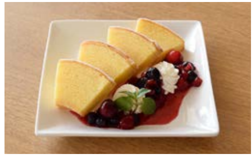
バウムクーヘンプレート(mixベリー) ¥750 ほんのり甘いバウムクーヘンと、 甘酸っぱいmixベリーの相性バツグン◎