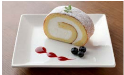
ロールケーキプレート ¥600 北海道産原乳から仕上げたふわふわの生クリームを、 やわらかなスポンジ生地で包みました