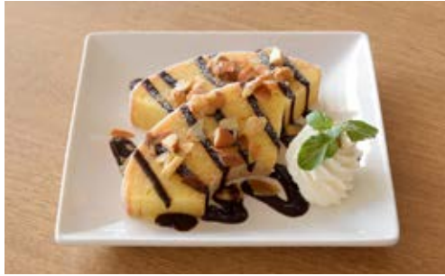
バウムクーヘンプレート(チョコナッツ) ¥750 ふわふわなバウムクーヘンと、 香ばしいナッツのサクサク食感をたのしんで