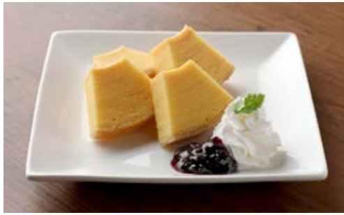
バウムクーヘンプレート(ブルーベリー) ¥600 治一郎の代名詞ともいえる定番のバウムクーヘン。 切りたてのふわふわな食感は絶品です