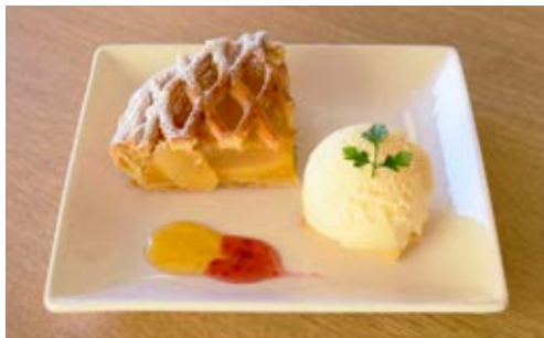
林檎パイプレート ¥700 酸味のきいた紅玉りんごを使用し、りんご酒をしみ込ませた バウムクーヘンをパイ生地にとじこめました